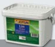
Jotun Lim Standard