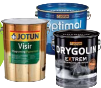
Underlag grunnet med Visir Oljegrunning Pigmentert