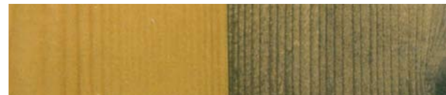
Nytt, ubehandlet treverk.

Kledningsbord som er ferdig grunnet fra produsent skal overmales snarest mulig og innen første malesesong. Er kledningsbordene tørre og rene kan kledningen overmales direkte. Husk imidlertid at alle kuttflater og "sår" i kledningen skal grunnes med Visir Oljegrunding. Er kledningsbordene skitne, må de vaskes før overmaling. Dersom ferdig grunnet kledning har stått lenge og blitt nedbrutt, må man utføre et mer grundig vedlikeholdsarbeid.